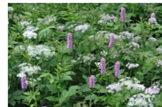
Kälberkropfwiesen: Gebirgs-Kälberkropf ( Chaerophyllum hirsutum ), Eisenhutblättriger Hahnenfuss ( Ranunculus aconitifolius ), Schlangen-Knöterich ( Polygonum bistorta )

In der Kälberkropfwiese können wir folgenden Arten begegnen: