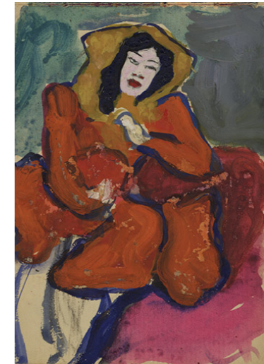
Fig. 1 Marianne Werefkin, Taccuino degli schizzi a22/11 (A. Sakharov), s.d. Tecnica mista su carta, 18 x 12,5 cm, Ascona, Fondazione Marianne Werefkin, Museo Comunale d'Arte Moderna

Ed è grazie a questi contatti, nel clima internazionale delle serate dadaiste, che va individuata la strada che porterà Jawlensky e Werefkin, e gran parte di questi artisti e intellettuali, a stringere o rinnovare rapporti con Ascona, sotto l'influsso della «Cooperativa individualista vegetabiliana Monte Verità», 4 nata nel 1901 sulle colline che sovrastano Ascona, da giovani anticonformisti in fuga dalla vita massificante e alienante delle metropoli nordeuropee verso un utopico ritorno ai valori originari della natura. 5 Rapidamente diventato laboratorio esemplare delle utopie di inizio Novecento, Monte Verità agisce infatti – soprattutto tra le due guerre – da catalizzatore privilegiato in Ticino di vegetariani, anarchici, teosofi, antroposofi, rosacroci, artisti radicali, imprenditori alternativi, occultisti, psicologi, filosofi; e artisti (pittori, scultori, danzatori) provenienti dall'ambiente internazionale del nascente Dada di Zurigo, che già intrattenevano relazioni stimolanti con la Scuola d'arte di Monte Verità (nata nel 1913 dall'integrazione nella comunità della Scuola di danza del coreografo, mistico e pedagogo Rudolf von Laban, che da Zurigo vi aveva trasferito i suoi corsi estivi) (fig. 4).