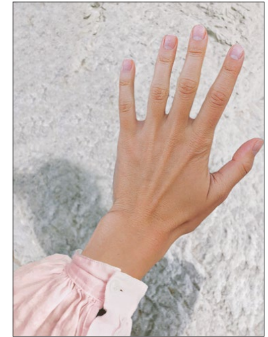
Inhaltliche Retuschen und Bildkollagen