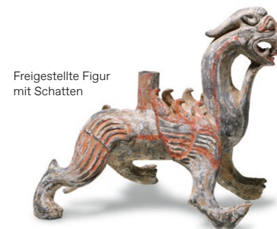
Freigestellte Figur mit Schatten