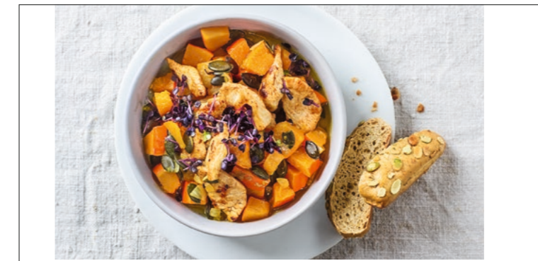
Für 2 Personen • 30 Min. Zubereitung • Pro Portion ca. 570 kcal, 42 g E, 21 g F, 57 g KH