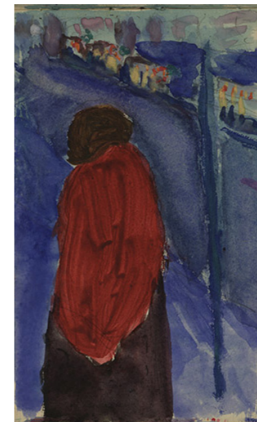
Fig. 2 Marianne Werefkin, Taccuino degli schizzi a11/74, s.d. Tecnica mista su carta, 18,2 x 11,1 cm, Ascona, Fondazione Marianne Werefkin, Museo Comunale d'Arte Moderna